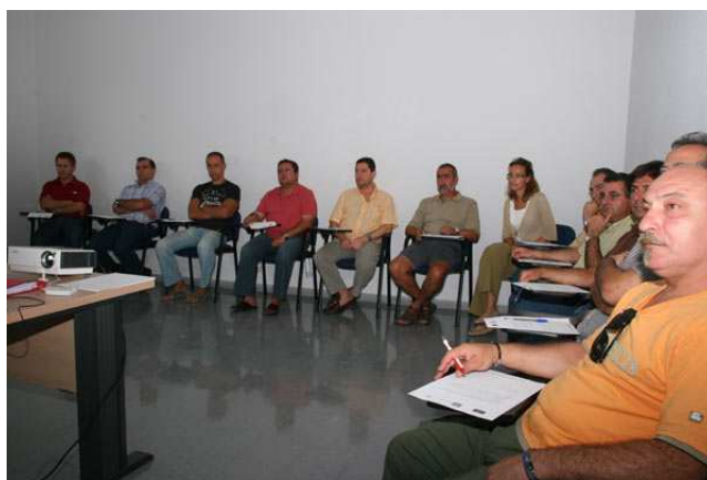
Una sesión formativa impartida a ex trabajadores de Delphi.

En la reunión se acordaron una serie de puntos, siendo el más destacado el del inicio de la cuarta fase del Programa de Formación Profesional que recibirán los ex trabajadores de Delphi este año. La Universidad de Cádiz (UCA) se encargará de ofrecerles formación semipresencial, a través de tres programas formativos distintos, según los perfiles de los participantes (profesionales, diplomados y licenciados, y antiguo personal de administración), todos de 650 horas, de las que 52 serán presenciales y de tutorías, y el resto, a distancia, mediante la plataforma on line de la Universidad.