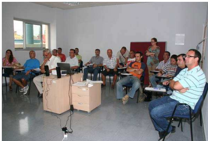
Ex trabajadores de Delphi asisten a una sesión presencial del Programa Brújula.

Una vez finalizada la etapa profesional desarrollada en este caso en Delphi, comienza una nueva fase en la que, tras pasar tantos años en la misma compañía y sin salir al mercado laboral, no siendo ya tan joven, lo habitual es que al profesional le asalten muchas dudas: ¿Y ahora cómo encuentro un nuevo empleo? ¿cómo me doy a conocer? ¿cómo y qué debo hacer para presentarme en una empresa?. En definitiva: ¿Cómo convierto mi formación y sobre todo mi experiencia, después de tantos años, en un valor tangible para una empresa?