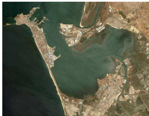
Imagen aérea de la Bahía de Cádiz.